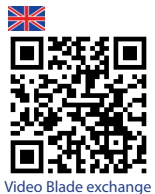
Video Blade exchange